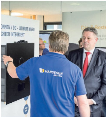
Umweltminister Andrä Rupprechter zu Besuch bei Hansesun Austria (Seite 2)