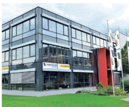
Photovoltaik Zentrum Vorarlberg in Röthis sehr beliebt (Seite 2)

produzierten Solarstrom zwischen zu speichern, um den Eigenverbrauch signifikant zu steigern. Stromspeicher sind eine Schlüsseltechnologie der Energiewende und stehen damit im Mittelpunkt unseres künftigen Versorgungssystems. Mehr dazu auf Seite 2 beim Thema „Stromspeicher – der nächste Schritt in Richtung Autarkie“