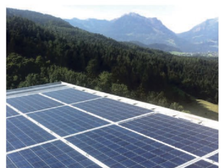
Erfolgreiche PV-Aktion wird auf weitere Gemeinden ausgedehnt (Seite 3)