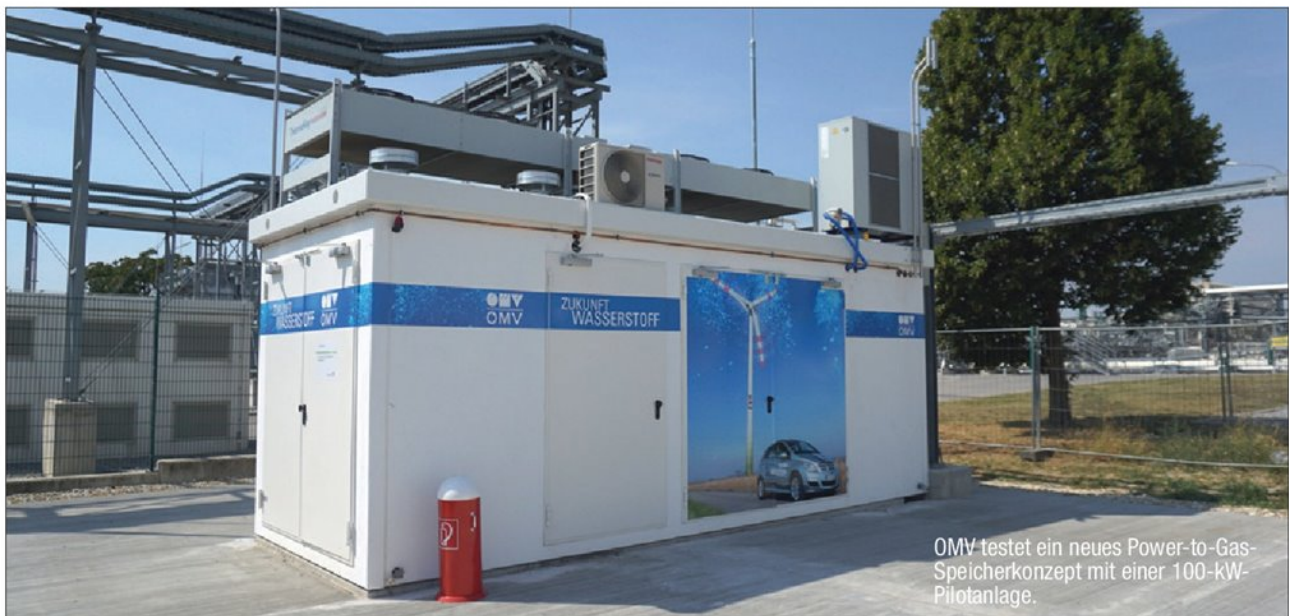
OMV testet ein neues Power-to-Gas-Speicherkonzept mit einer 100-kW-Pilotanlage.